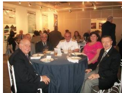
Centro Cultural da Marinha em São Paulo.

No dia 28 de abril, no Centro Cultural da Marinha ocorreu um almoço de confraternização entre o Almirante Bittencourt do 8º Distrito Naval e as SOAMARES de São Paulo. A SOAMAR Campinas esteve presente para prestigiar o evento.