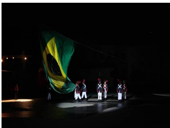
Flash da Parada Após o Pôr- do-Sol.