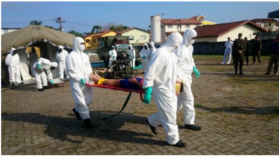
Simulações de descontaminação de veículos e pessoas. No caso da MB, a faina foi realizada pela Companhia de Defesa Nuclear, Biológica, Química e Radiológica (DefNBQR).