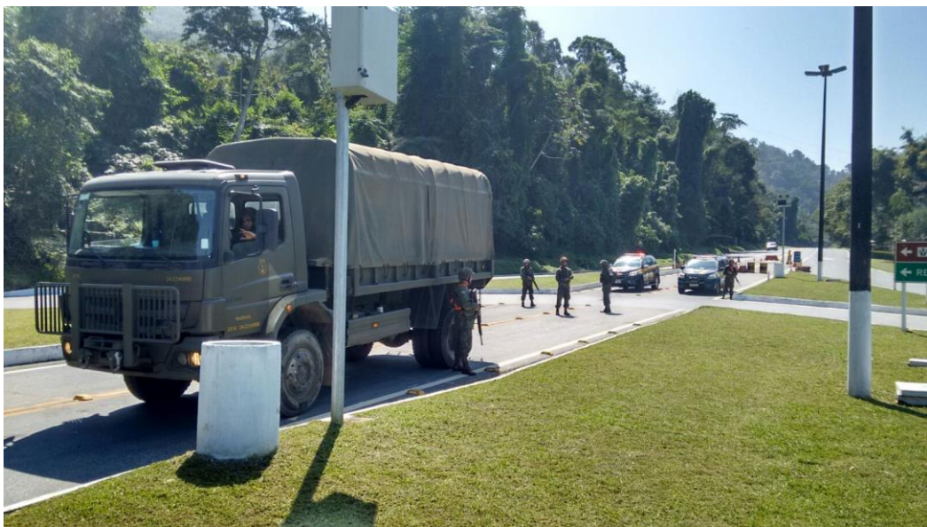
Realização de interdições terrestres a partir de pontos de controle de trânsito.