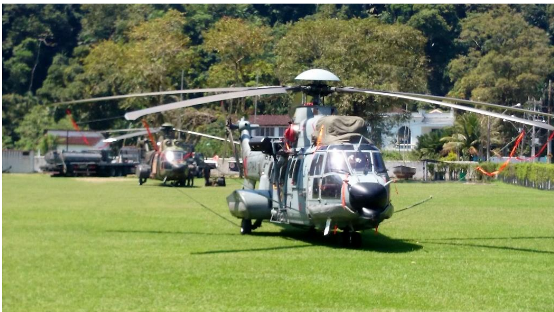
GT Aéreo responsável pela evacuação aeromédica de pacientes radioacidentados para o HNMD.