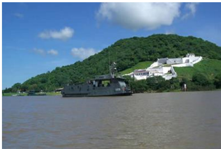
Navio-Patrolha Piratini (P10)