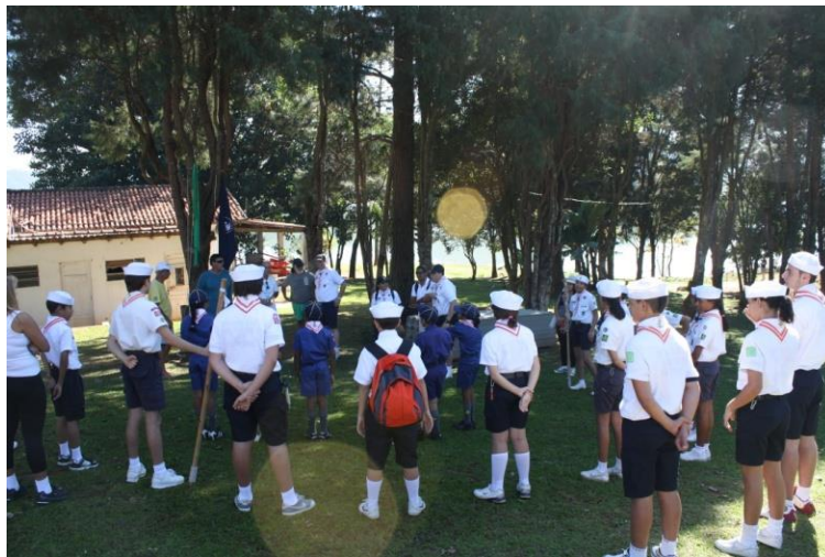
Escoteiros do Mar Velho Lobo fazendo a Bandeira na atividade de Canoagem e Vela.