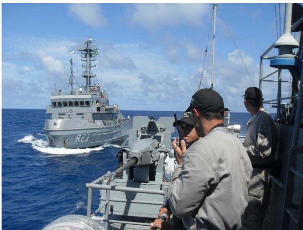
exercício de Leap-Frog entre o Navio Patrulha “Goiana” e o Rebocador de Alto-Mar “Triunfo”.

A operação foi extremamente importante para elevar o nível de adestramento dos navios do GT 350.1, pois nas diversas fases de mar foram realizados exercícios específicos para navios operando em Grupo-Tarefa, tais como, LEAP-FROG, LIGHT LINE, manobras táticas, exercícios de comunicações visuais, rádio e dados, dentre outros. Assim, foi uma excelente oportunidade para os navios distritais operarem em Grupo-Tarefa, pois normalmente operam escoteiros na maioria de suas comissões em suas áreas de jurisdição.