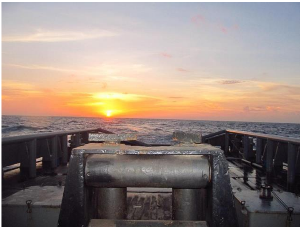
pôr do sol visto da popa do RbAM Triunfo

No dia 09MAI, o GT suspendeu em direção ao Porto de Belém, atracando no dia 15MAI e encerrando com sucesso a Operação CARIBEX-2013.