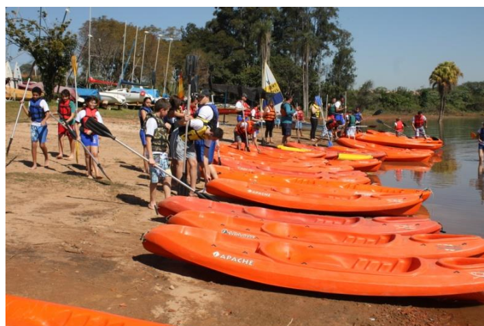
Os escoteiros do Mar e seus caiaques indo para onde interessa...a água!