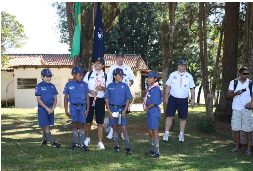
Integração de três novos Lobinhos apresentados por sua Prima (nome da Monitora de Lobinhos).

Note no braço desse Monitor o Distintivo de Trilha.