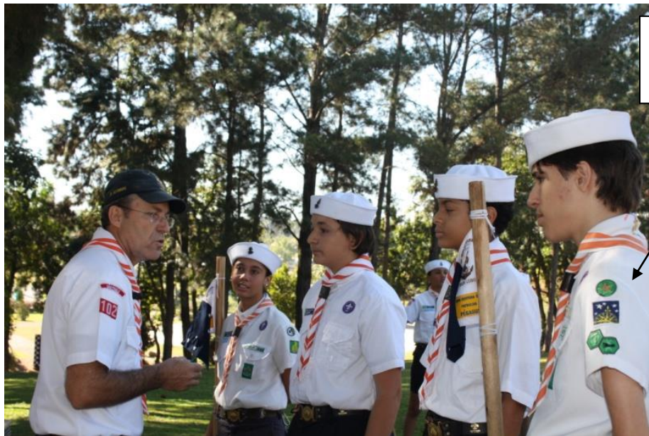
Promessa Escoteira de dois novos Escoteiros do Mar, apresentados

Note no braço desse Monitor o Distintivo de Trilha.