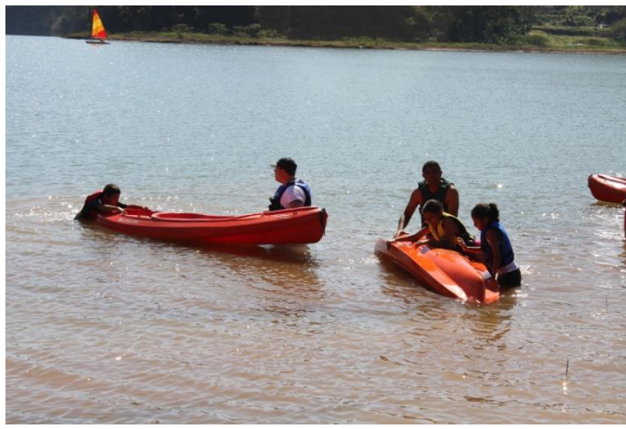
Aprendendo a desvirar e retornar ao caiaque em casos de acidentes.