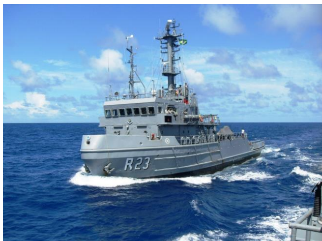
Rebocador de Alto-Mar "Triunfo"

No presente ano, eu tive a honra de ser o Comandante do Grupo-Tarefa 350.1 (GT 350.1) da operação CARIBEX-2013 que era composto pelo Rebocador de Alto-Mar Triunfo e Navio-Patrulha Goiana, do Comando do Grupamento de Patrulha Naval do Nordeste; e pelo Navio-Patrulha Guarujá, do Comando do Grupamento de Patrulha Naval do Norte.