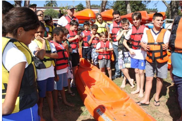
Nossa aula teórica sobre caiaque e canoagem.