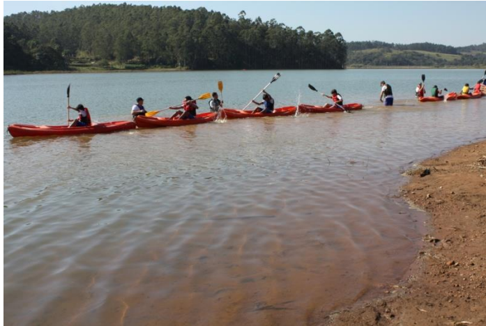
Como bons Escoteiros do Mar, nosso cabo de guerra foi embarcado nos caiaques...