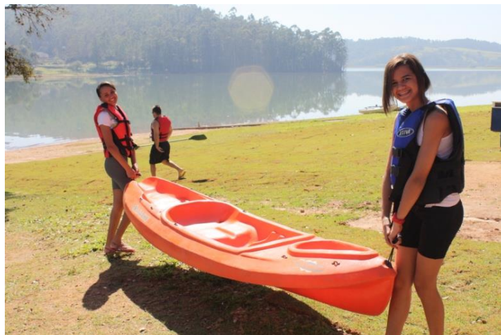
Hora de trabalhar.