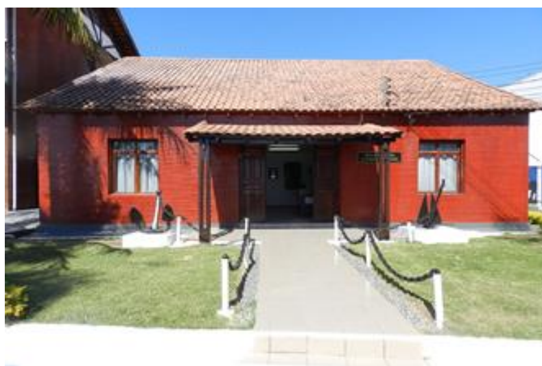
Hospital Naval de Ladário (HNLa)