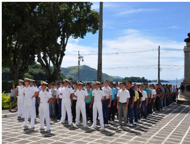
Em 2013 o Colégio Naval recebeu 236 novos alunos