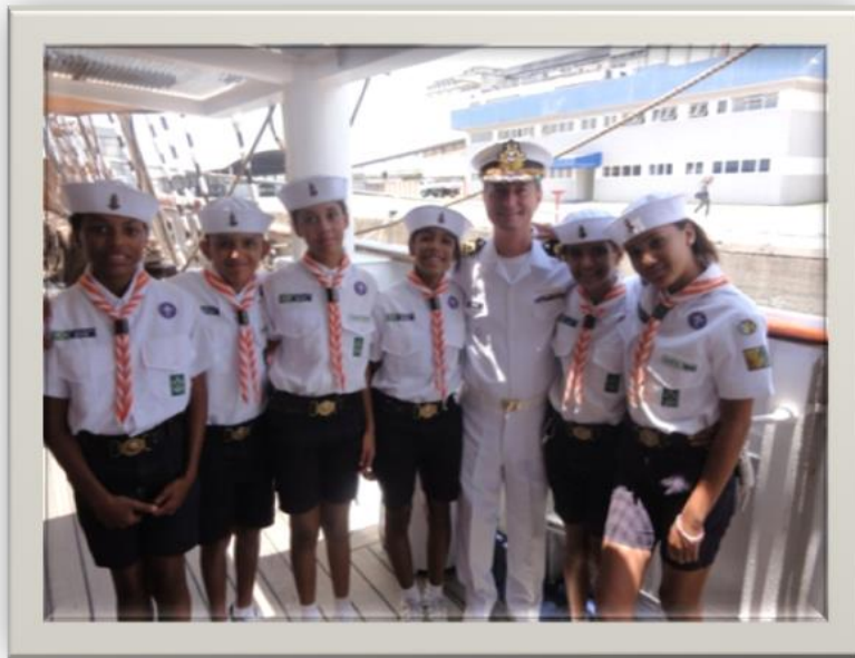
Escoteiros com o Comandante do navio CMG NELSON