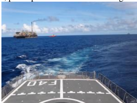
Esquadra presente na Bacia de Campos

No mês de maio, a Div-2 conduziu a Operação Pesquisex-I, quando esteve presente na Bacia Petrolífera de Campos, desenvolvendo atividades relacionadas à avaliação e aprimoramento de procedimentos, e realizando operações focadas no patrulhamento das águas jurisdicionais brasileiras na área marítima compreendida entre Rio de Janeiro e Vitória. Nesta comissão, o Comandante da Força e seu Estado-Maior estiveram embarcados na Corveta Barroso. Além deste Navio que foi projetado e construído no Brasil, participaram da comissão a Fragata Greenhalgh e a Fragata Niterói.