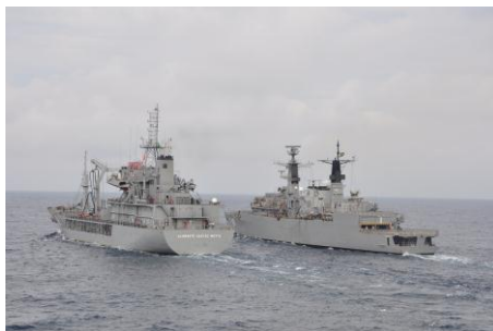
Fragata se aproxima para Reabastecimento no Mar

Durante o ano de 2012, a Divisão sob meu comando já desenvolveu inúmeras atividades, conduzindo a Operação ADEREX-I (Abril), com a participação dos seguintes meios navais: Fragata Niterói, Fragata Greenhalgh, Fragata Bosísio, NT Alte Gastão Motta, Submarino Tupi e Helicópteros da Força Aeronaval. Nesta viagem foram realizados diversos exercícios na área marítima compreendida entre o Rio de Janeiro e Santos. Nesta operação, a Força Naval esteve presente na Bacia de Santos, realizando ações de patrulha naval e presença na área do Pré-sal, região de importância estratégica de nossa Amazônia Azul. Ainda nesta operação a Esquadra teve a oportunidade pioneira de operar com a recém-adquirida aeronave P-3AM, da Força Aérea Brasileira.